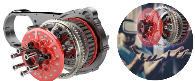
Modelo cortesía de BAKER Drivetrain