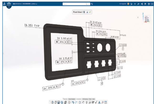
設計要件を迅速かつ直感的に3次元で定義します。